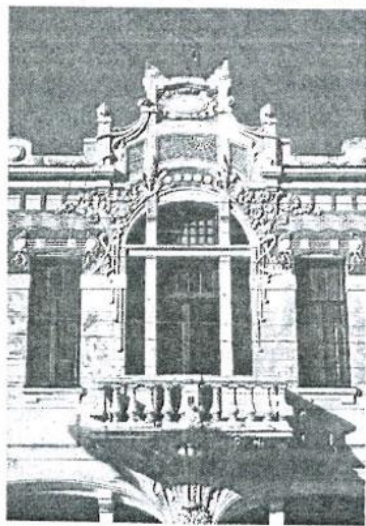
Иллюстрация 1. Поты. Жилой дом для одной семьи. 1905 г. Архитектор неизвестен.

В этом случае не только здания, но и сам факт является значимым и важным, так как, с одной стороны, "это все-таки было одним, громко сказанным словом для подтверждения национального существования и жажды национального выражения, да еще и словом, произнесенным в столице Грузии, где грузины давно же не чувствовали себя хозяевами" [4:45], и, с другой стороны, это было подтверждением того, что нация готова к началу настоящего творческого процесса, что вскоре и было подтверждено созданием архитектуры в стиле модерн. Страна, которая, несмотря на продолжительную европейскую ориентацию, никогда не имела тесной культурной интеграции с Европой, была не в состоянии своевременно и должным образом реагировать на явления, происходящие в европейском искусстве. В начале XX века Грузия активно, абсолютно естественным образом включается в творческий процесс нового стиля. Новый стиль распространился в Европе под разными названиями: