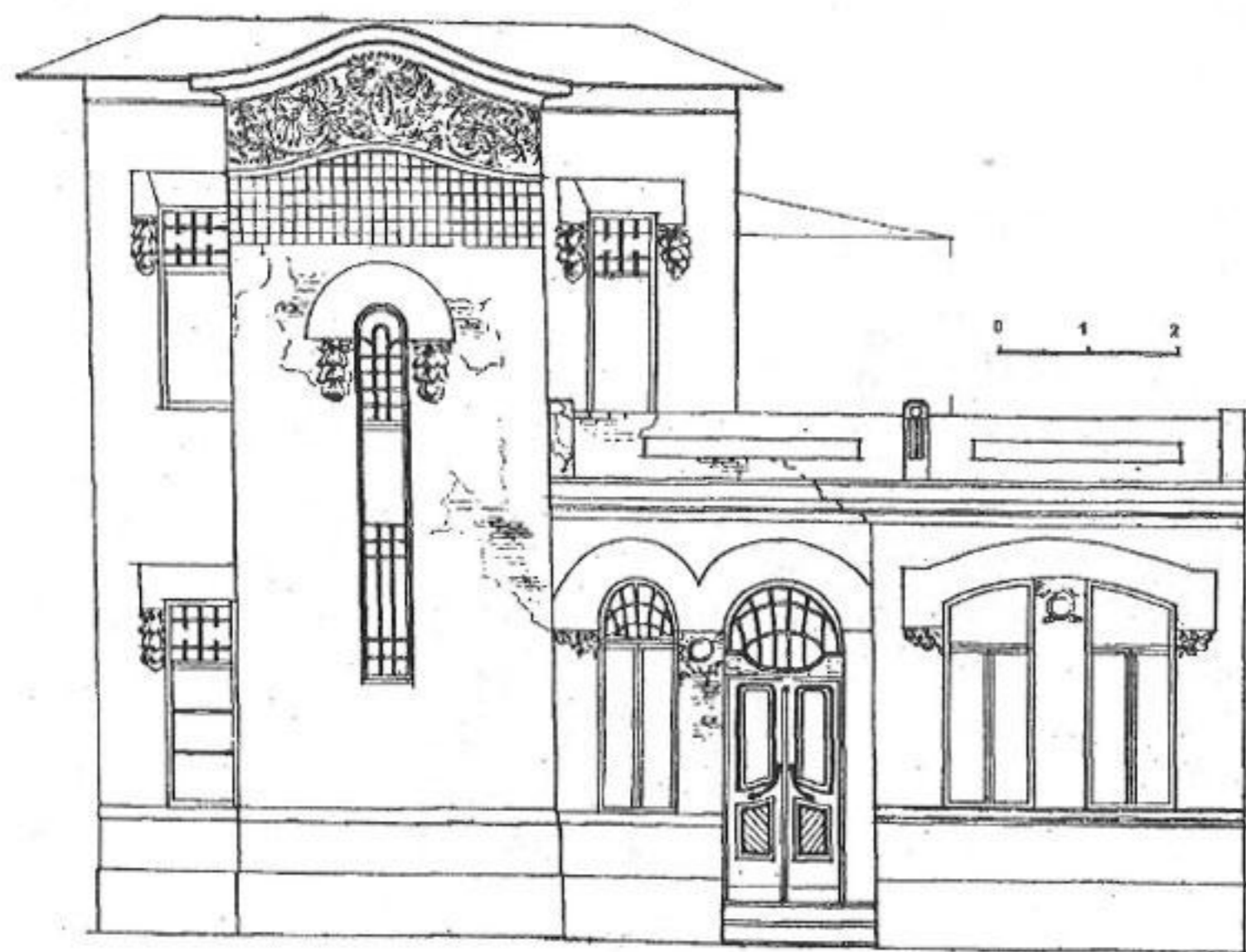
Иллюстрация 4. Тбилиси, ул. Ии Каргаретели № 36. Жилой дом для одной семьи. 1903 г. Архитектор неизвестен.