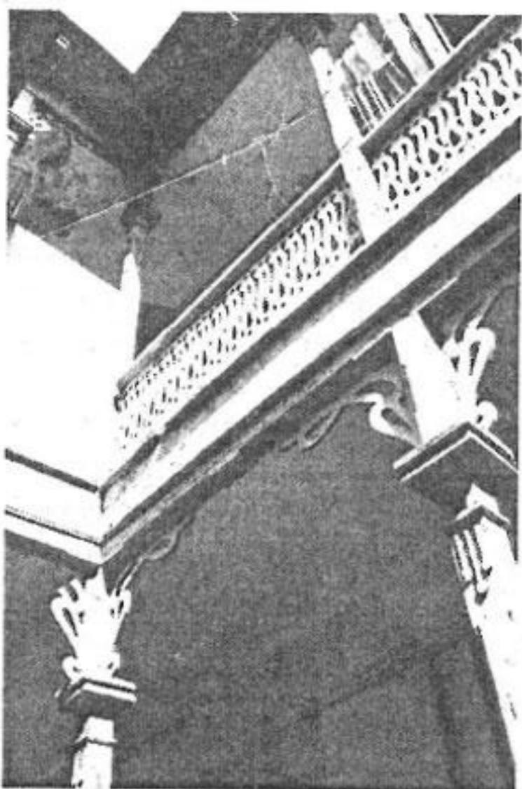
Иллюстрация 7. Тбилиси, ул. Ал. Чавчавадзе, 1, пер. № 1. Жилой дом. На заднем фасаде – фрагмент деревянного балкона. 1910 г. Архитектор неизвестен.

То же можно сказать и о находящемся на ул. Костава, № 38 роддоме, выполненном в стиле модерн, бывшем Институте акушерства (построенном