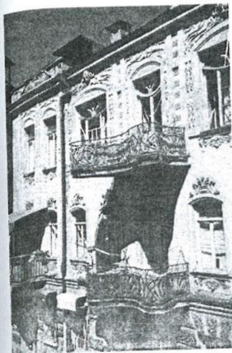
Иллюстрация 5. Тбилиси, ул. Вардцихе, № 4. Многоквартирный жилой дом. 1902 г. Архитектор С. Клдиашвили.