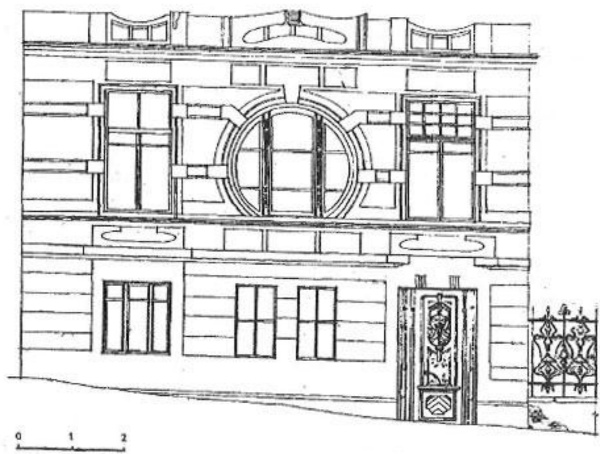
Иллюстрация 3. Тбилиси. Ул. Св. Або Тбилели, № 6. 1901 г. Архитектор неизвестен.