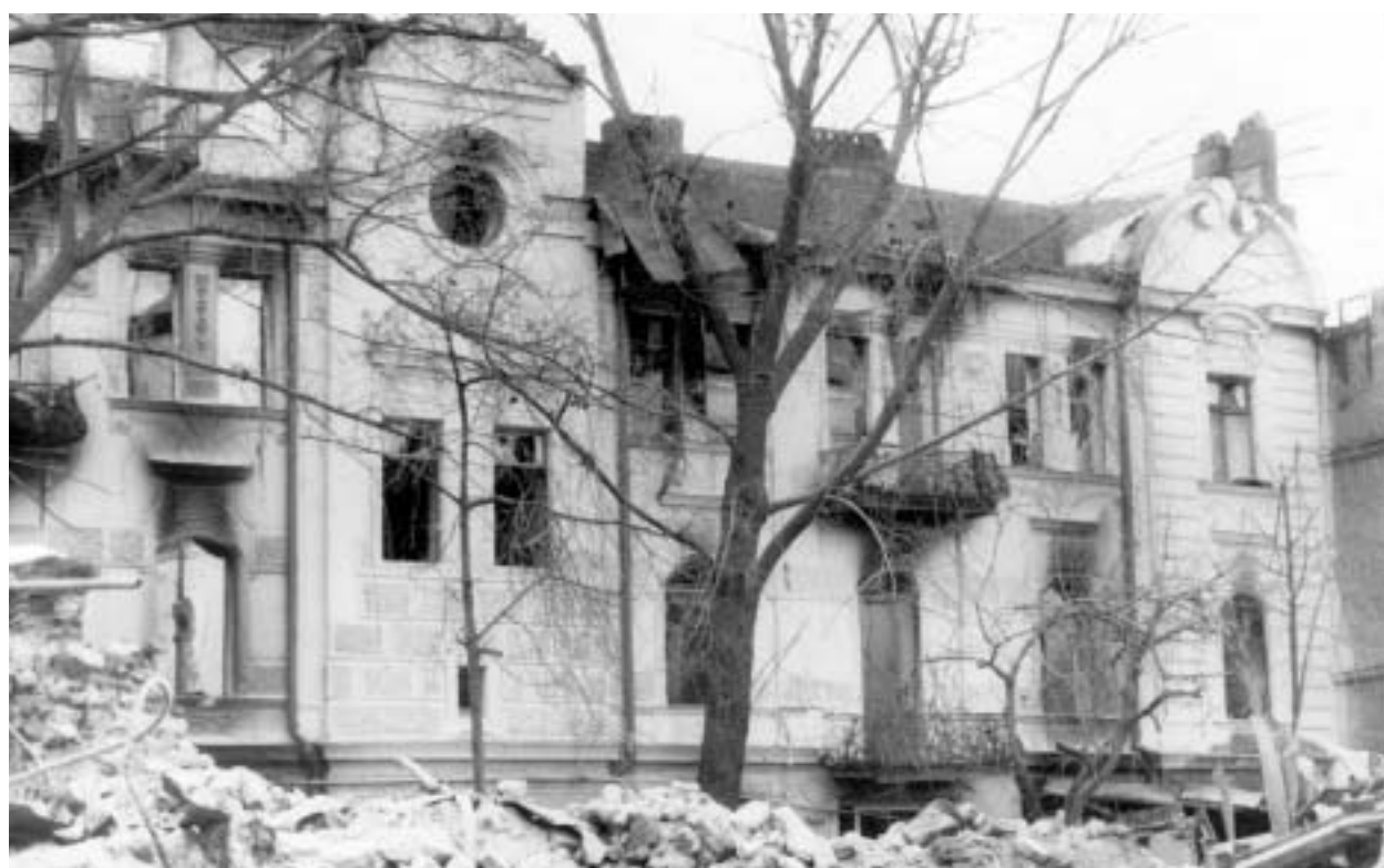
1992 წელი - თავისუფლების მოედანი №4 ა

ლი ფიზიკური არსებობიდან ნახაზულ ე.წ. "სამემოსავლო სახლს" არქიტექტორ-რესტავრატორების: თემო აბრამიშვილის, მურთაღ ურდიაის, მარინე ქართველიძისა და ფოტოხელოვან გეორგი ბიანიანის მეშვეობით, რომლებმაც დოკუმენტურად შეგიწინარესეს არამარტო ეს შენობა, არამედ მისი მიმდებარე ნაგებობებიც.