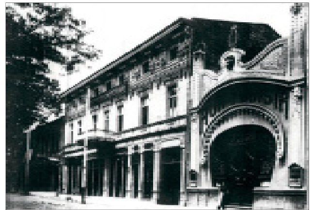
ფოტო 5. კინოთეატრი “მონპლეზირ”, ქუთაისი.

სრულიად უცნობი იყო, დღეს უკვე საერთაშორისო ყურადღებით სარგებლობს. ამ სტილის არქიტექტურის სრულად გამოვლენა, შესწავლა და პოპულარიზაცია, მისი დაცვისა და გადარჩენისათვის საჭირო ღონისძიებების განხორციელება 1997 წლიდან დაიწყო ჩვენმა ჯგუფმა, თუმცა როგორც სპეციალისტი, თავად 1983 წლიდან ვმუშაობ ამ თემაზე.