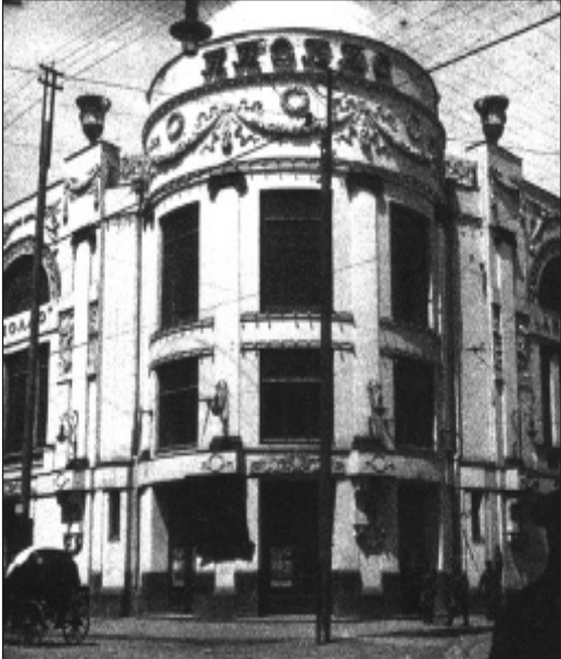
ფოტო 1. ელექტროთეატრი “აპოლო”. 1910-იანი წლების პირველი ნახევარი. საქართველოს ხელოვნების სახელმწიფო მუზეუმის არქივი

საქართველოში მოდერნის სტილით უმეტესად საცხოვრებელი და საშემოსავლო სახლები შენდებოდა, მაგრამ ძალზე ხშირია სხვა დანიშნულების შენობებიც: ბანკები, სასწავლებლები, მაღაზიები, კინოთეატრები, საავადმყოფოები, სახელოსნოები, ფაბრიკები. შესანიშნავი მემორიალური ძეგლებია