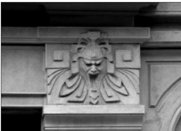
ფოტო 6. “მუსიკალური ცენტრი”, ყოფილი კინოთეატრი “პალასი”. დ აღმაშენებლის 125. 1907 წ.

რაც შეეხება თბილისში 1914 წელს აშენებულ კინოთეატრ “პალასს” (დღევანდელი “მუსიკალური ცენტრი”. დავით აღმაშენებლის 125. იხ ფოტო 6), რომლისგან დღეს მხოლოდ შესასვლელი დარბაზი და ფასადის მცირე ფრაგმენტებია გადარჩენილი, უკვე დიდი ხანია რაც კინოდ აღარ ფუნქციონირებს. ერთადერთი ძველი კინოთეატრი, რომელიც თითქმის თავდაპირველი სახით შემოგვრჩა, ეს თბილისის “აპოლოა”. მისი მნიშვნელობა ქართული კულტურის, ზოგადად მოდერნისა და კინოს ისტორიისთვის ნამდვილად შეუცვლელია.