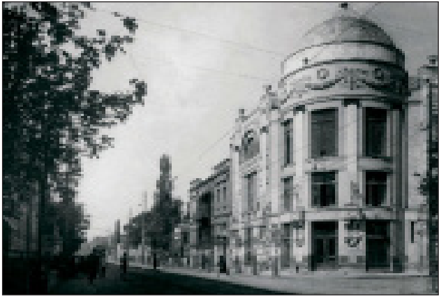
ფოტო 2. ელექტროთეატრი “აპოლო”. 1909 წ.

დაცული ძეგლ, ისტორიულ სასაფლაოებზე. ბევრი შენობის ფუნქცია თბილისელი ოსტატებისთვის უკვე ნაცნობი და თავის დროზე დამუშავებულია, მაგრამ არის თვისობრივად ახალი თემებიც – მაგალითად, კინოთეატრები, რომელთა პროექტებიც აგრეთვე წარმატებით განხორციელდა ჩვენს დედაქალაქში. ამის თვალსაჩინო მაგალითია 1909 წელს აშენებული კინო – ელექტროთეატრი “აპოლო” (დავით აღმაშენებლის 135. იხ. ფოტო 1 და 2)