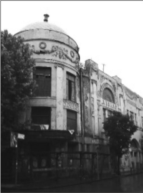
ფოტო 3. "აპოლო". 2007 წ.

როგორც აღვნიშნეთ, ის ამჟამად მძიმე ტექნიკურ მდგომარეობაშია და დიდი ხანია აღარ ფუნქციონირებს (იხ. ფოტო 3).