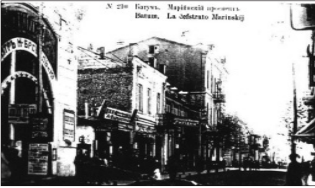
ფოტო 4. კინოთეატრი “აპოლო”, ბათუმი.

ლია. ცნობილია, რომ მსოფლიოში მოდერნის სტილით აშენებული მხოლოდ რამდენიმე კინოთეატრი თუ არსებობს და მათ შორის არის ჩვენი “აპოლოც”.