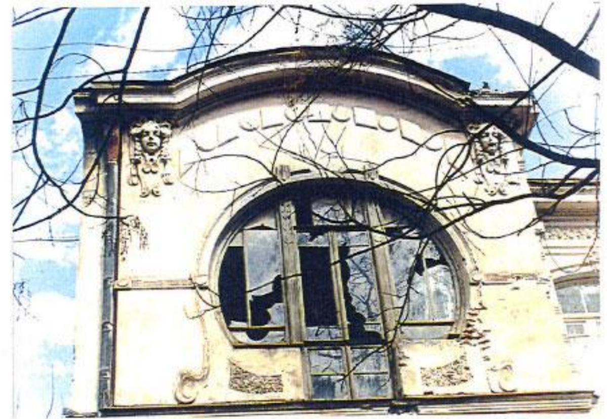
თბილისი კოჯორის ქ. 3