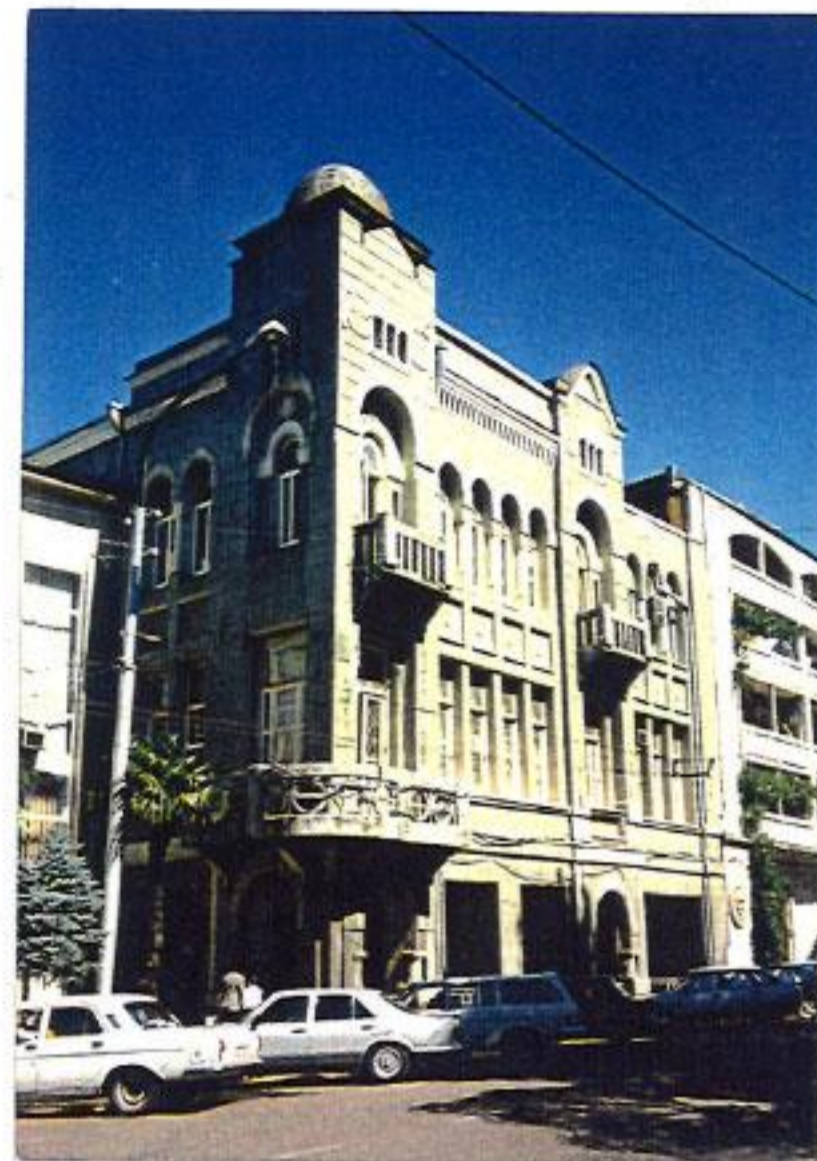
ქუთაისი, ფალიაშვილი ქ 33