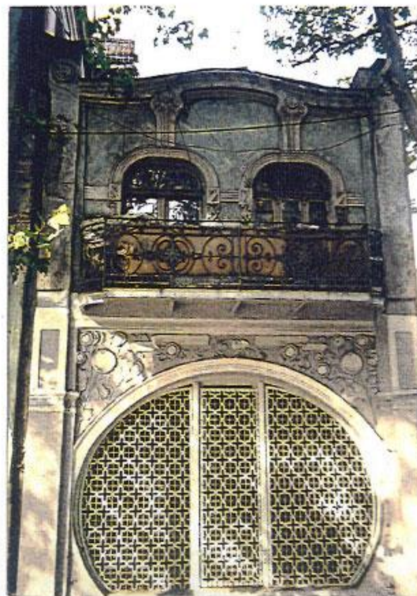
თბილისი, ლეონიძის ქ 7