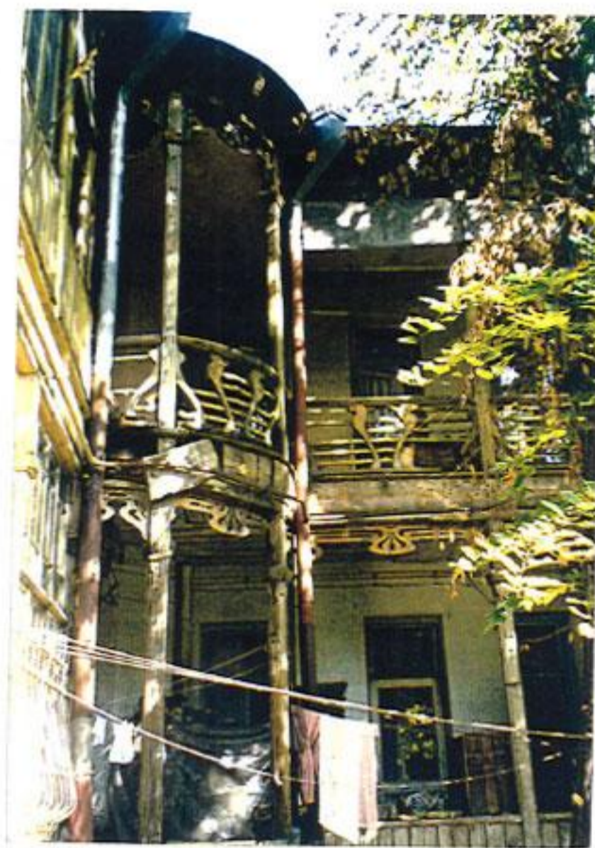
თბილისი, ვაშლოვანის ქ 6 შიდა ეზო