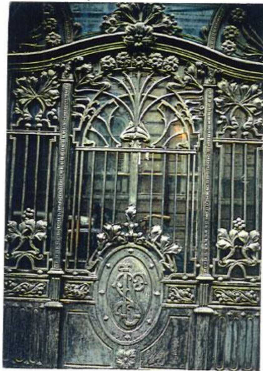
თბილისი, მახაბლის ქ 13 სადარბაზოს კარი