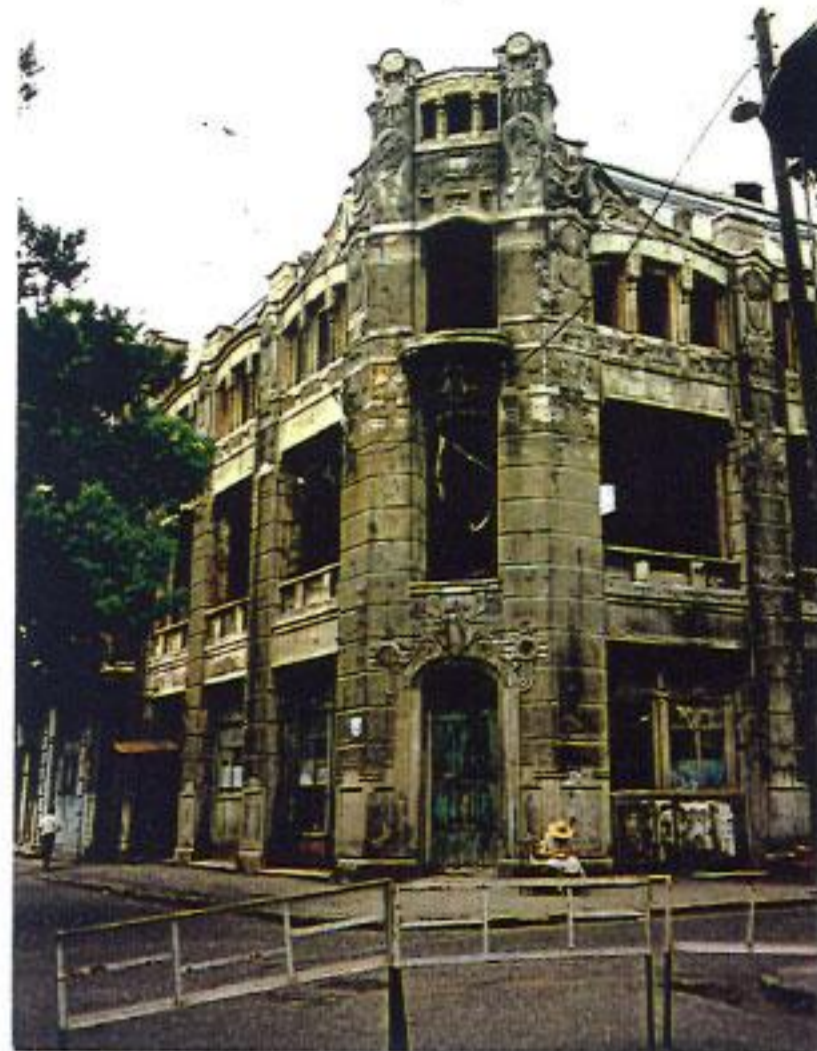
ბათუმი, 9 აპრილის ქ 12

სამწუხაროდ დაგვარგეთ ბევრი კარგი შენობა თუ ცალკეული ფრაგმენტი. მაშინ, როცა მსოფლიოს მასშტაბით ამ სტილით დაინტერესება თანდათან უფრო ინტენსიური ხდება, ჩვენთან მისი მნიშვნელობა ხშირად პროფესიონალებსაც არა აქვთ შეგნებული. მაგალითად, თბილისში აღარ არსებობს ერთ-ერთი მშენიერი მოდერნის ძეგლი მდებარე თავისუფლების მოედანი №4ა, რომელიც 1991-1992 წწ. მოვლენების დროს დაიწვა. შემდეგ კი მთლიანად დაანგრიეს. მისი აღდგენა, მოუხედავად ფოტოების და ანაზომების არსებობისა, შესაბამისმა ორგანიზაციებმა და სპეციალისტებმა საჭიროდ არ მიიჩნიეს (11, ხოლო მეორე ძეგლს (გ. ლეონიძის ქ. №3, სადაც ამჟამად ეროვნული ბანკია განთავსებული), რამოდენიმეჯერ ჩატარებული ფუნდამენტური რეკონსტრუქციის "წყალობით", თავდაპირველი ელემენტების მხოლოდ მცირე ნაწილი შემორჩა როგორც ფასადზე, ასევე ინტერიერშიც. საგანგაშოა, რომ მისი, როგორც ძეგლის განადგურება ამჟამადაც გრძელდება, მოუხედავად იმისა, რომ მიმდინარე სამუშაოები არქიტექტორ-რესტავრატორთა მონაწილეობით! ხორციელდება. ამ უბედურების ერთ-ერთი მთავარი მიზეზი მოდერნის სტილის შეუსწავლულობა და საზოგადოების გაუთვითცნობიერებაა, პროფესიონალთა უპასუხისმგებლობაზე და მათი მომზადების დაბალ დონეზე რომ აღარაფერი ვთქვათ. მოდერნის არქიტექტურული