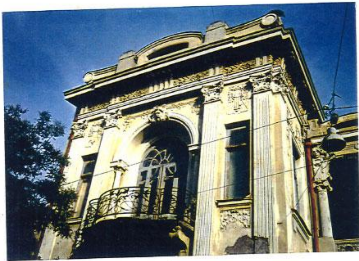
თბილისი ქიქოძის ქ. 4