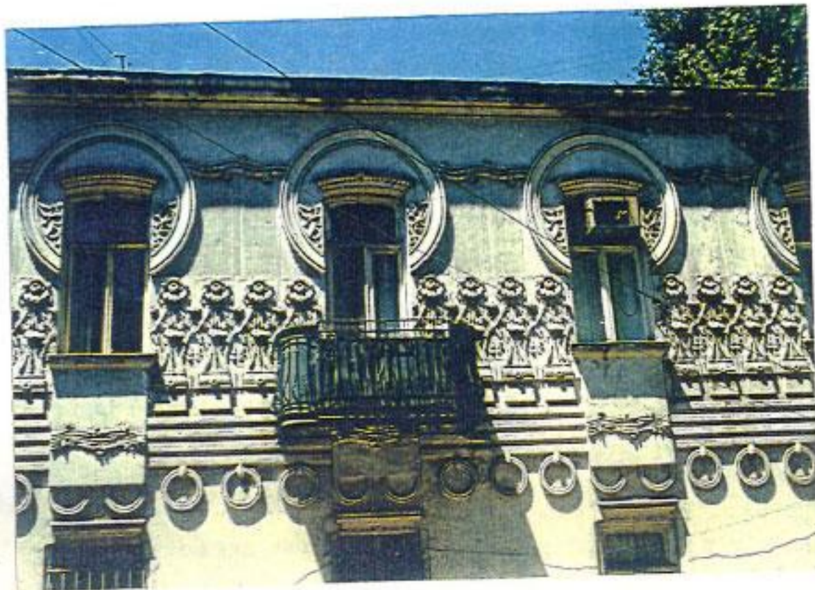
თბილისი მანიაშვილის ქ. 16