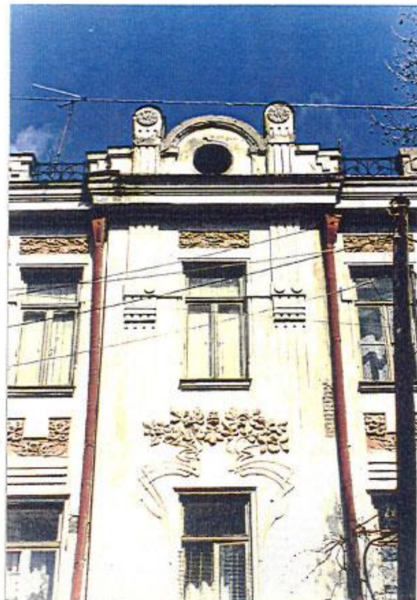
თბილისი, დავითაშვილის ქ 7