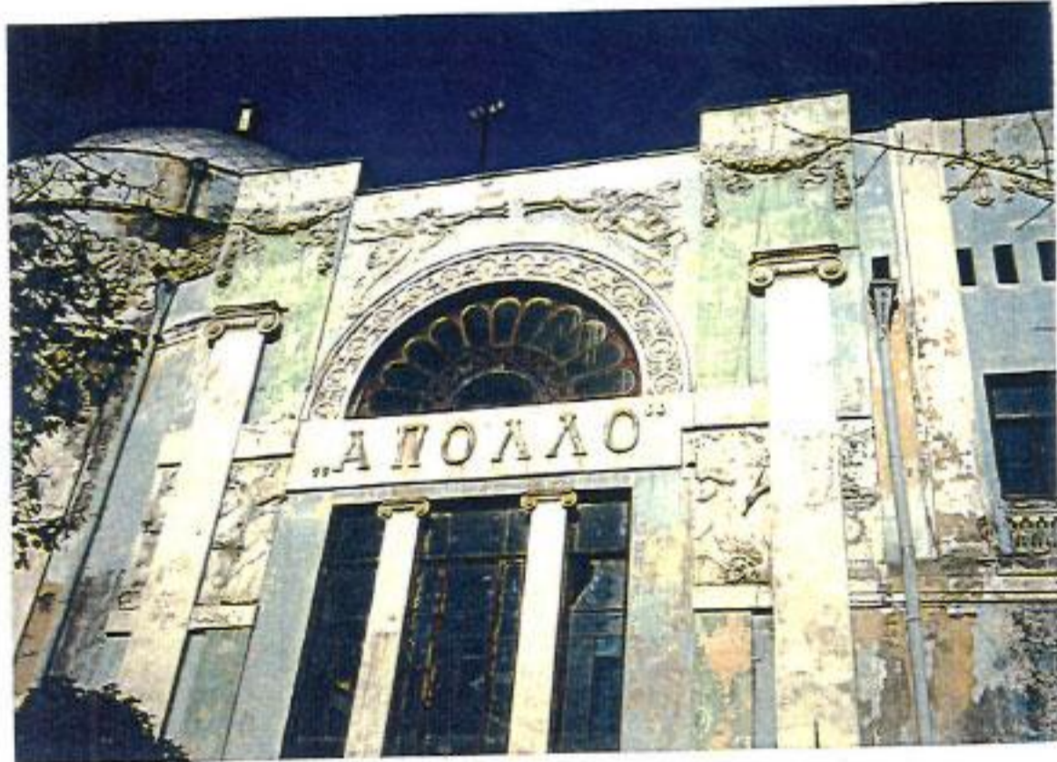
თბილისი ალმაშენებლის გამზ. 133