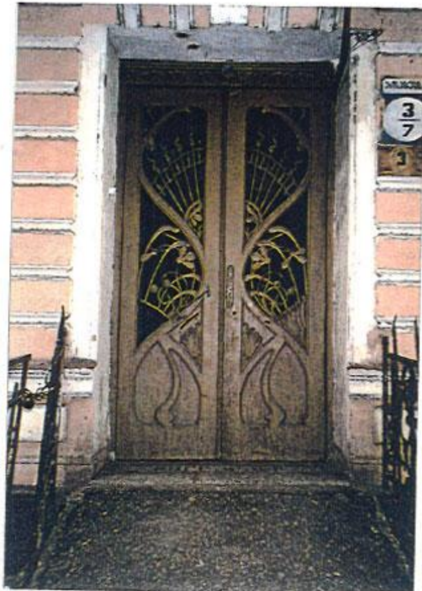
თბილისი, ახოსპირელის ქ 5/7

ძველები საჭიროებენ სრულ გამოფლენას საქართველოს ყველა ქალაქში, აღრიცხვას, სამეცნიერო კვლევასა და ფართო პოპულარიზაციას. ამ მიმართებით პირველი სერიოზული სამუშაოს ჩატარება შესაძლებელი გახდა 1997 წელს ფონდის "ღია საზოგადოება-საქართველოს" დახმარებით 21 ქ პრალაში სამეცნიერო დახმარების სქემის ( RSS ) კონკურსში გამარჯვებამ, კი 1998 წელს, საშუალება მოგვცა ჩავატაროთ საარქივო-კვლევითი სამუშაოები (ღისანიშნავია რომ დასახელებული ორივე ორგანიზაციის დაფინანსება წარმოებს მეცენატ ჯორჯ სოროსის მიერ).