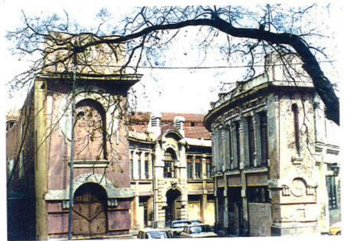
თბილისი ბნელი რიგი