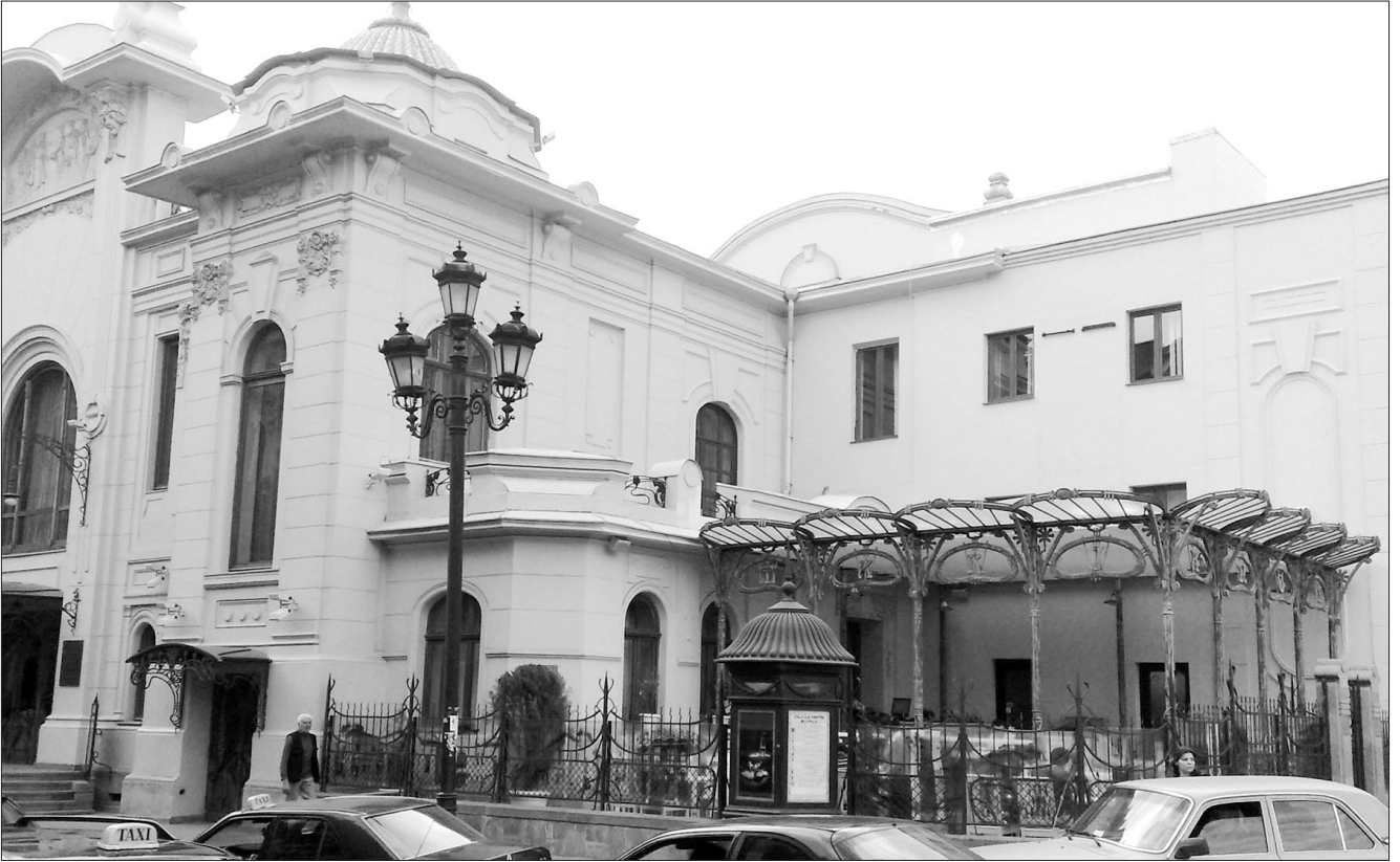
“სახალხო სახლი”. (ამჟამად კ. მარჯანიშვილის თეატრი), არქიტექტორი ს. კრიჩინსკი, შენობის მთავარ ფასადზე მიშენებული რესტორანი “მარჯანოვ-ექსპრესი”. 2008 წ.

ციალისტებისა და სახელისუფლებო სტრუქტურების მიერ ხორციელდება, ამიტომ გამკითხავიც არავინაა.