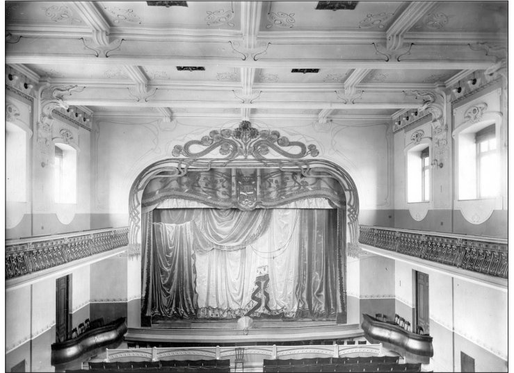
“სახალხო სახლი” (ამჟამად კ. მარჯანიშვილის თეატრი), არქიტექტორი ს. კრიჩინსკი. 1909 წ.

სამართლიანობა მოითხოვს, რომ ამ შენობას (და არა მარტო ამ, ან ზუბალაშვილების სხვა შენობებს, არამედ ქართველი მეცენატების მიერ ხალხისთვის ნაბოძარ ყველა ნაგებობას) თავისი პირვანდელი ფუნქცია დაუბრუნდეს. ფუნქციის დაბრუნებასთან ერთად უმნიშვნელოვანესია თითოეული მათგანის სწორი და დეტალური რესტავრაცია.