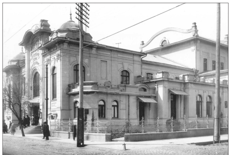
“სახალხო სახლი” არქიტექტორი ს. კრიჩინსკი. 1909 წ.

ზუბალაშვილების წინაპარმა 1830-იან წლებში თბილისის ცენტრში სასახლე აიშენა (ახლანდელი საქართველოს ხელოვნების სახელმწიფო მუზეუმი), რომელიც 1837 წელს სიმბოლურ ფასად, თითქმის საჩუქრად გადასცა სასულიერო სემინარიას. მათ საქართველოში ააგეს 5