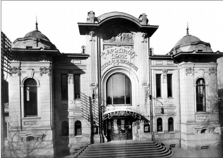
“სახალხო სახლი” (ამჟამად კ. მარჯანიშვილის თეატრი), არქიტექტორი ს. კრიჩინსკი, 1909 წ.

შემდეგ, 1933 წელს, ამ თეატრს მისი სახელი ეწოდა და დღესაც, კონსტანტინე ზუბალაშვილის სახელობის “სახალხო სახლში” კოტე მარჯანიშვილის სახელობის თეატრი მოღვაწეობს.