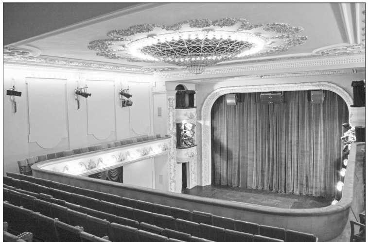
“სახალხო სახლი” (ამჟამად კ. მარჯანიშვილის თეატრი), არქიტექტორი ს. კრიჩინსკი, 2007 წ.

ასეთ პირობებში ნამდვილად დამაკმაყოფილებლად უნდა ჩავთვალოთ, მაგრამ გაუგებარია, რატომ არ განხორციელდა ცენტრალური ფასადის, მისი კარისა და ლითონის ნიმუშების სრული რესტავრაცია. ჩვენთვის აუხსნელია ამ პროექტზე მომუშავე სპეციალისტთა პოზიცია და მოტივაცია. ერთი კი ცხადია, რომ გაუმართლებელია ამ ეროვნული მნიშვნელობის ძეგლზე ჩატარებული მათი ე. წ. “შემოქმედებითი რესტავრაცია”, რომლის შედეგად აღდგა მთავარი ფასადის ცენტრალური კარი, მაგრამ არ გაუქმდა საბჭოთა დროს გაკეთებული 2 კარი