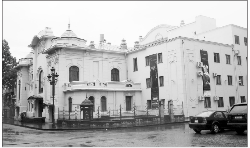
“სახალხო სახლი” (ამჟამად კ. მარჯანიშვილის თეატრი), არქიტექტორი ს. კრიჩინსკი, 2007 წ.

კათოლიკური ეკლესია, სერიოზული თანხებით ეხმარებოდნენ თბილისის თვითმმართველობას, წერა-კითხვის გამავრცელებელ საზოგადოებას, დიდი წვლილი შეიტანეს უნივერსიტეტისა და კონსერვატორიის მშენებლობაში; ნიჭიერ ახალგაზრდებს სასწავლებლად აგზავნიდნენ ევროპის ცნობილ უნივერსიტეტებში. მათი გახსნილია პირველი უფასო სასაბავშვო „სამადლო“ და „უპოვართა თავშესაფარი“ თბილისში. აგრეთვე ქალაქის ღარიბი მოსახლეობისთვის