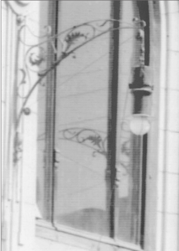
“სახალხო სახლი” (ამჟამად კ. მარჯანიშვილის თეატრი) არქიტექტორი ს. კრიჩინსკი, 1909 წ.