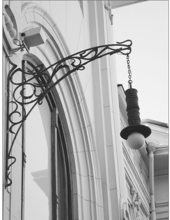
“სახალხო სახლი” (ამჟამად კ. მარჯანიშვილის თეატრი), არქიტექტორი ს. კრიჩინსკი, 2007 წ.

თავდაპირველ დეტალებს, ზიანს აყენებს ძეგლის აუთენტურობას. საუბედუროდ, ეს საშინელი პროცესი დღესაც გრძელდება და დაუსჯელობის გამო ლამისაა უკვე ტრადიციად იქცეს.