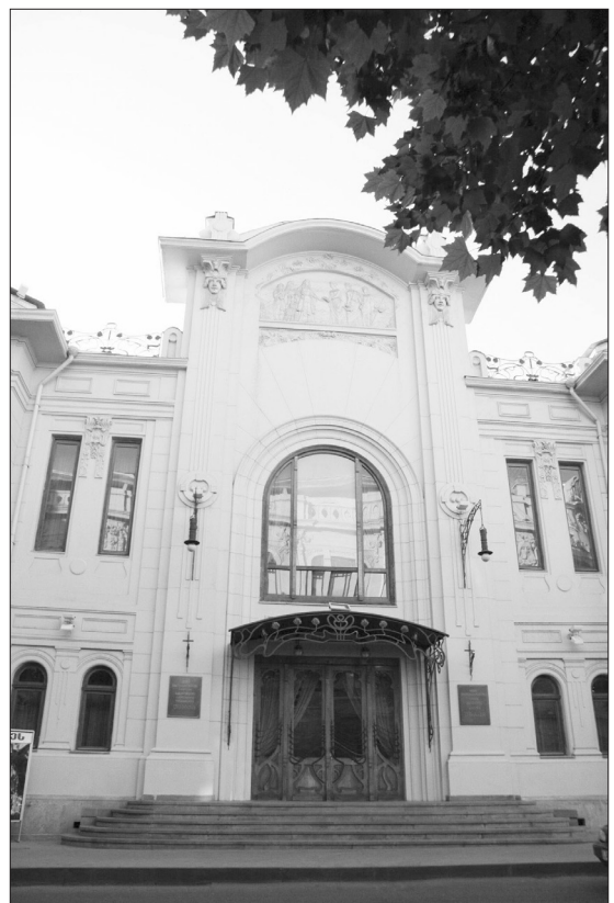
“სახალხო სახლი” (ამჟამად კ. მარჯანიშვილის თეატრი), არქიტექტორი ს. კრიჩინსკი, 2007 წ.

ძმების - ლევან, სტეფანე, პეტრე და იაკობ ზუბალაშვილების მიერ მამის, კონსტანტინეს, ხსოვნის უკვდავსაყოფად 1907 წელს თბილისში აშენებული “სახალხო სახლი”, დღეს კოტე მარჯანიშვილის სახელმწიფო აკადემიური თეატრია. აქ 1930 წელს დაბინავდა ცნობილი ქართველი რეჟისორის, კოტე მარჯანიშვილის მიერ 1928 წელს ქალაქ ქუთაისში დაარსებული საქართველოს II სახელმწიფო დრამატული თეატრი. კოტე მარჯანიშვილის გარდაცვალების