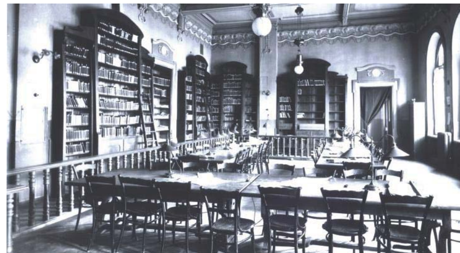
© Museum of Art of Georgia