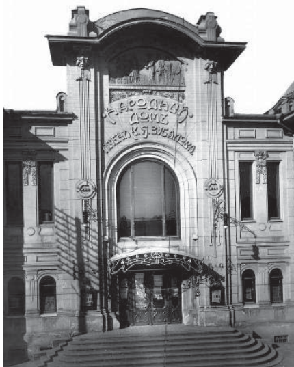
© Museum of Art of Georgia

A banda de la Casa del Poble, a Geòrgia hi van construir cinc esglésies catòliques i un hospital infantil, van col·laborar en la construcció dels edificis de la Universitat i del Conservatori, i van obrir les tres primeres cantines i llars per als pobres. Van enviar molts joves de talent a estudiar a les millors universitats del món.