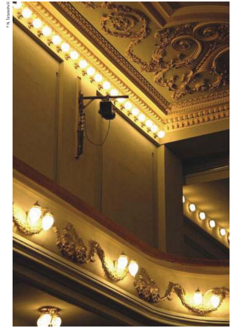
Detail of the present-day theatre Detall del teatre actual