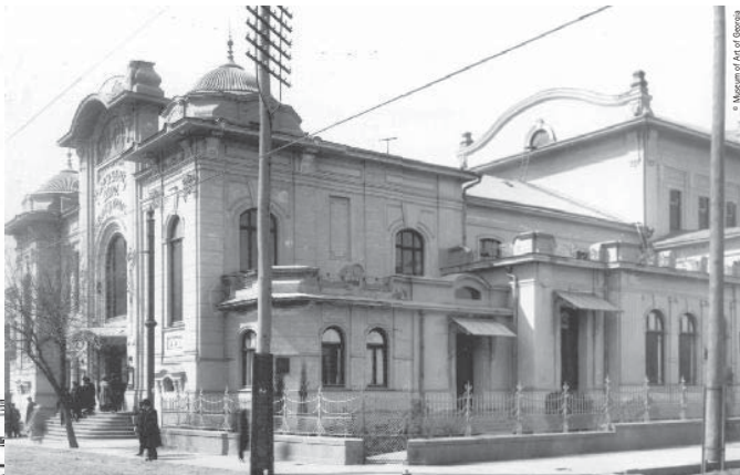
Museum of Art of Georgia Nektan Iatashvili