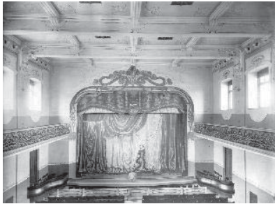
Museum of Art of Georgia

Són tants els casos de danys i destrucció dels edificis modernistes de Geòrgia, que aviat caldrà demanar l'atenció de les organitzacions internacionals. I aquest és, en part, l'objectiu d'aquest article. www.mcs.gov.ge